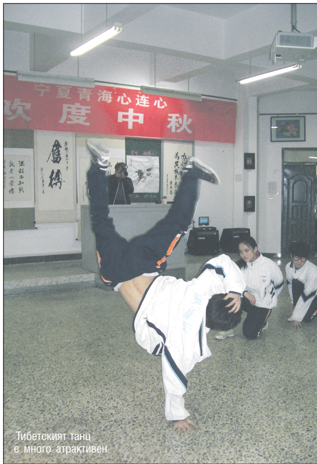
Тибетският танц е много атрактивен

Повишаването на доходите и стандарта на големи маси хора означава и стимулиране на вътрешния пазар, на вътрешното потребление, което всъщност ще гарантира на 1,3-милиарден Китай икономическа самостоятелност и относителна независимост от външни финансово-икономически кризи. Ето защо, въпреки че приносят на Нинся в общия стопански живот на държавата е едва 0,44%, централните власти дават