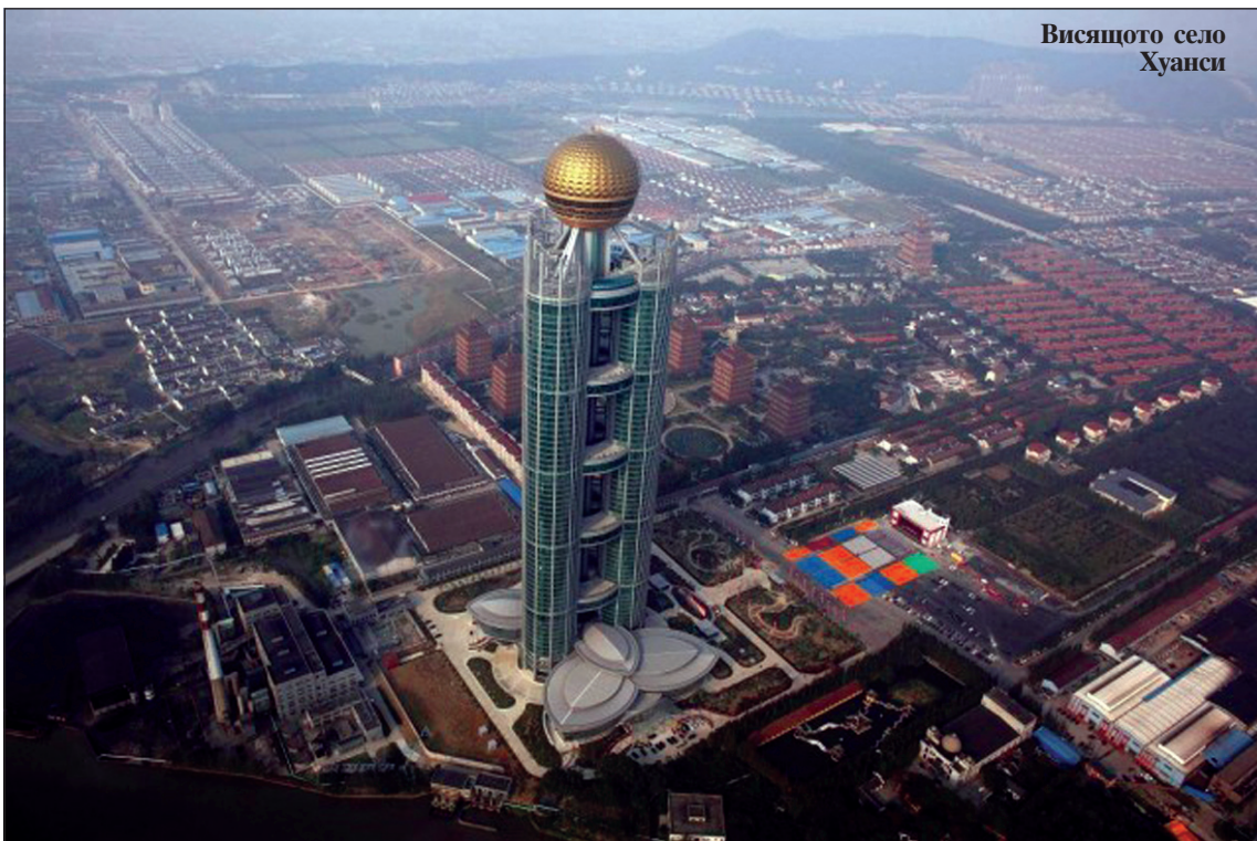
Висящото село Хуанси